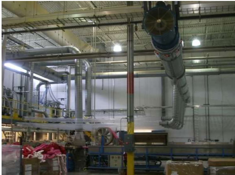
Fagerdala World Foams, Marrysville, USA Aircode blev utvald av DEQ till BACT