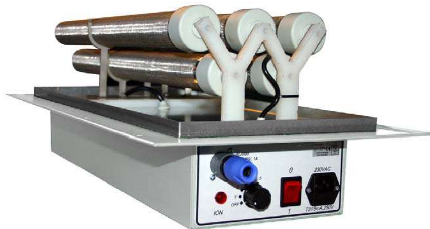
Aircode ID AC-500 För montering i ventilationssystem