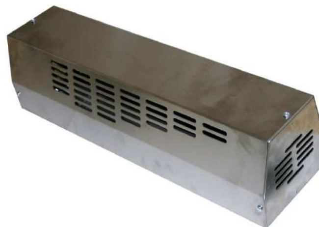
Aircode CX-100 Montering med 4 skruv och en stickkontakt