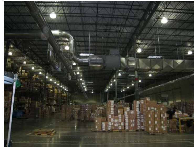
Crocs Distribution Center, Denver, USA Partikel och gas eliminering av 27 000m 2