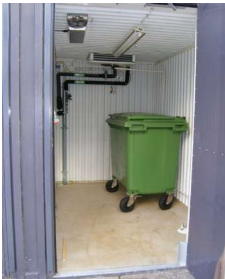
Soprum i Helsingborg 15 minuter efter kylan stängdes av så var odören borta