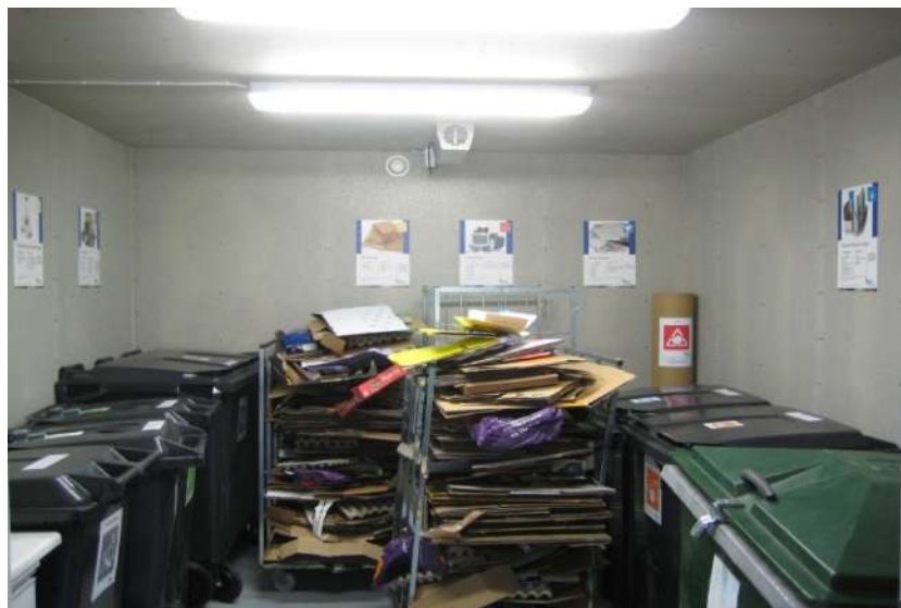
Danderyds kommun Sparade 100 000 tals kronor vid byggandet av Stocksundsgården.